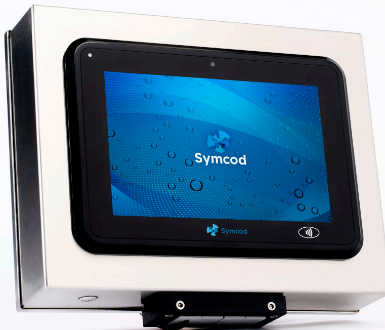
W101M-65, écran tactile de 10.1" avec caméra et lecteur de proximité intégrés

Compact et polyvalent; le W101M-65 est le type d'appareils tout-en-un qu'il vous faut !