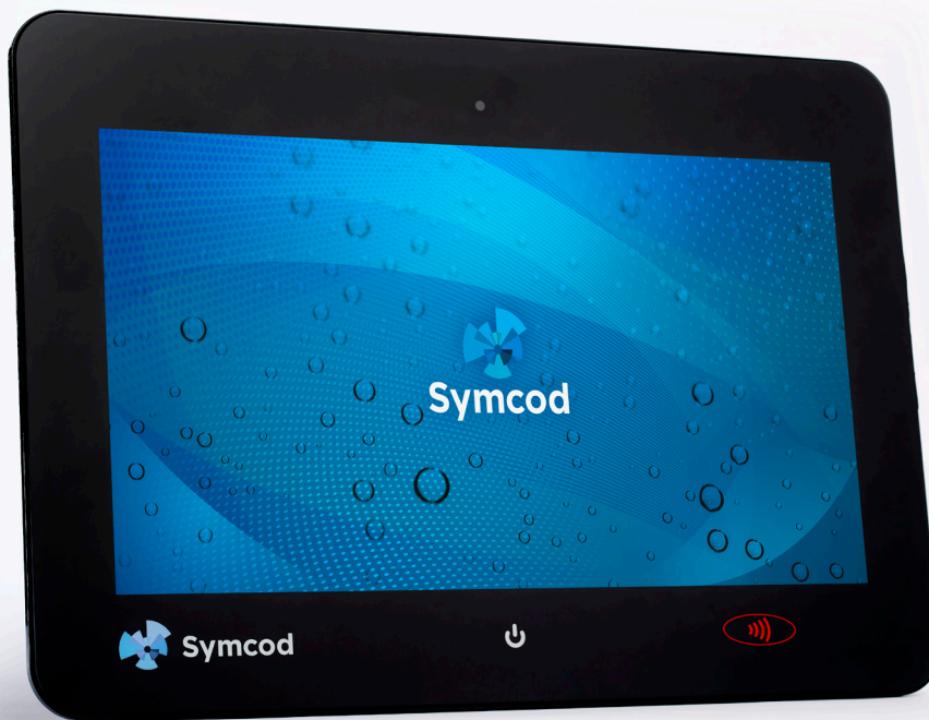
W185M-69K, écran tactile de 18.5" avec caméra et lecteur de proximité intégrés

Reconnu selon les plus hauts standards de qualité et normes de l'industrie; le W185M-69K est l'ordinateur tout-en-un à l'épreuve de l'eau qu'il vous faut!