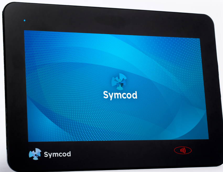
TermiCom W185M-DP, écran tactile de 18.5" avec lecteur de proximité intégré

Résistant aux chocs et étanche aux poussières, le modèle TermiCom W185M-DP peut-être utilisé avec des gants; c'est exactement le type de moniteur qu'il vous faut!